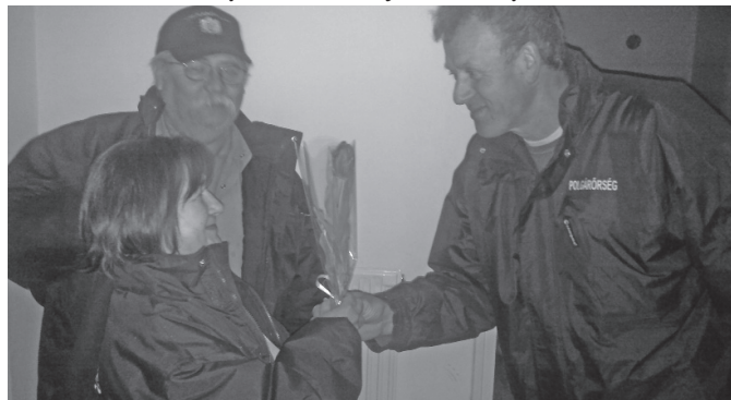
Egy szál virággal kedveskedtünk hölgy tagjainknak

Talajvízzel kapcsolatban a következőket szeretnénk kérni. Vízvezető árokba történő kinyomatást kellő körültekintéssel végezzék, az árok befogadó képességét figyelembe véve. Olyan helyen, ahol nincs árok, ott közterületre tilos az útra és járdára kinyomatni.