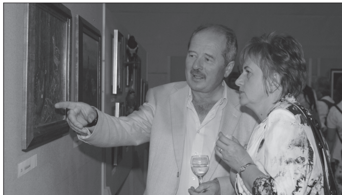
Sokan megnézték a kiállításokat