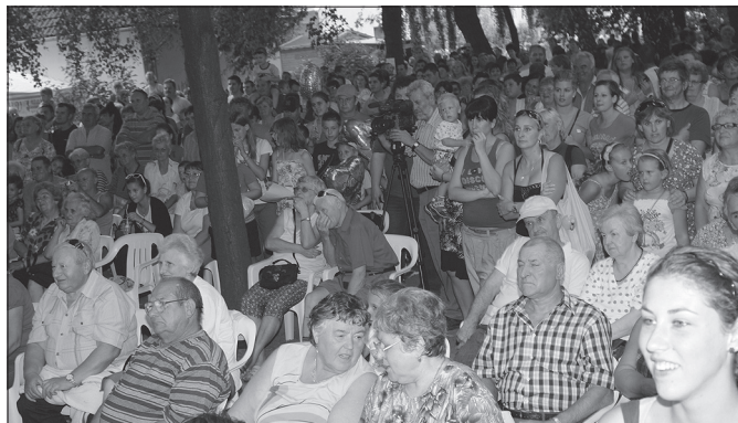
Közösen mulattunk a parkban egész szombaton