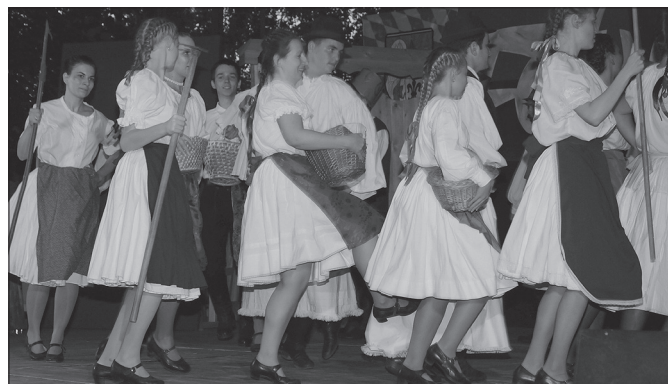
A pénteki „Szökött katona” előadás nagy siker volt