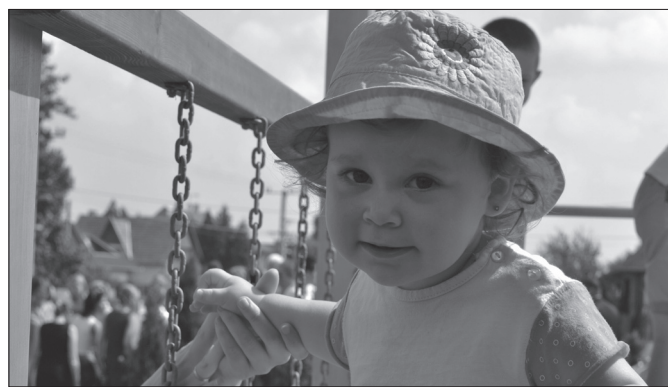
A játszótéravató is része volt az ünnepnek