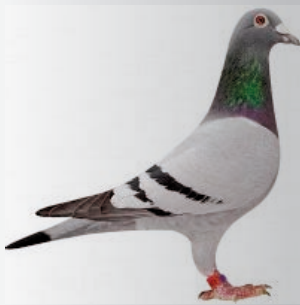
D-6 Postagalamb Egyesület Nagyvenyim