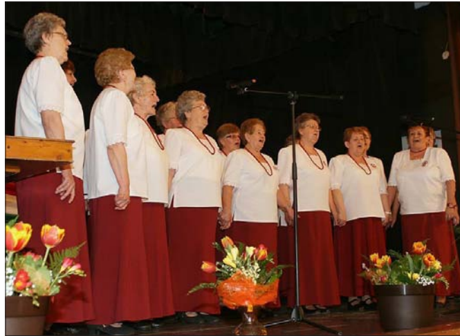
Sikere volt a dalkörünknek a Solti Tavasz Napokon

Április 11., a Költészet Napja alkalmából Nagyvenyimen 12. éve szervezzük