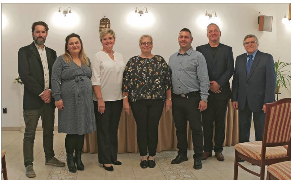
Nagyvenyim képviselő-testülete az október 9-én megtartott alakuló ülésen

dülállóan és országosan is ritkaságként a Nagyvenyimen élők nem fizettek helyi adót miközben a helyi vállalkozások iparűzési adóztatása is kedvezményes. Emellett a helyi társadalmi szervezetek, magánszemélyek és vállalkozások is az együttműködési szándékkal szembesülnek, továbbá hathatós segítséget kapnak a pályázati rendszerek, támogatási konstrukciók elérhetősége körében. A település folyó működési költségeinek összege az elérhető források tükrében nagyságrendjében (nem, hogy reálértékében, de sajnos nominálisan is) azonos a 20-25 évvel ezelőttivel, miközben több új intézményt alapítottunk, és jelentős fejlődésen ment át a község infrastrukturális rendszere is. Sajnálatos tapasztalás, hogy azon értékeinket, amelyek előteremtésében nem vett részt a helyi társadalom, nem is óvja kellőképpen. Kifejezetten magas összegeket kell költenünk a rongálás okozta károk mellett az illegális szemetelés következményeinek rendezésére is, miközben a természetes fejlődési igények mellett a városi környezetből érkező lakosság további új, költségeket jelen-